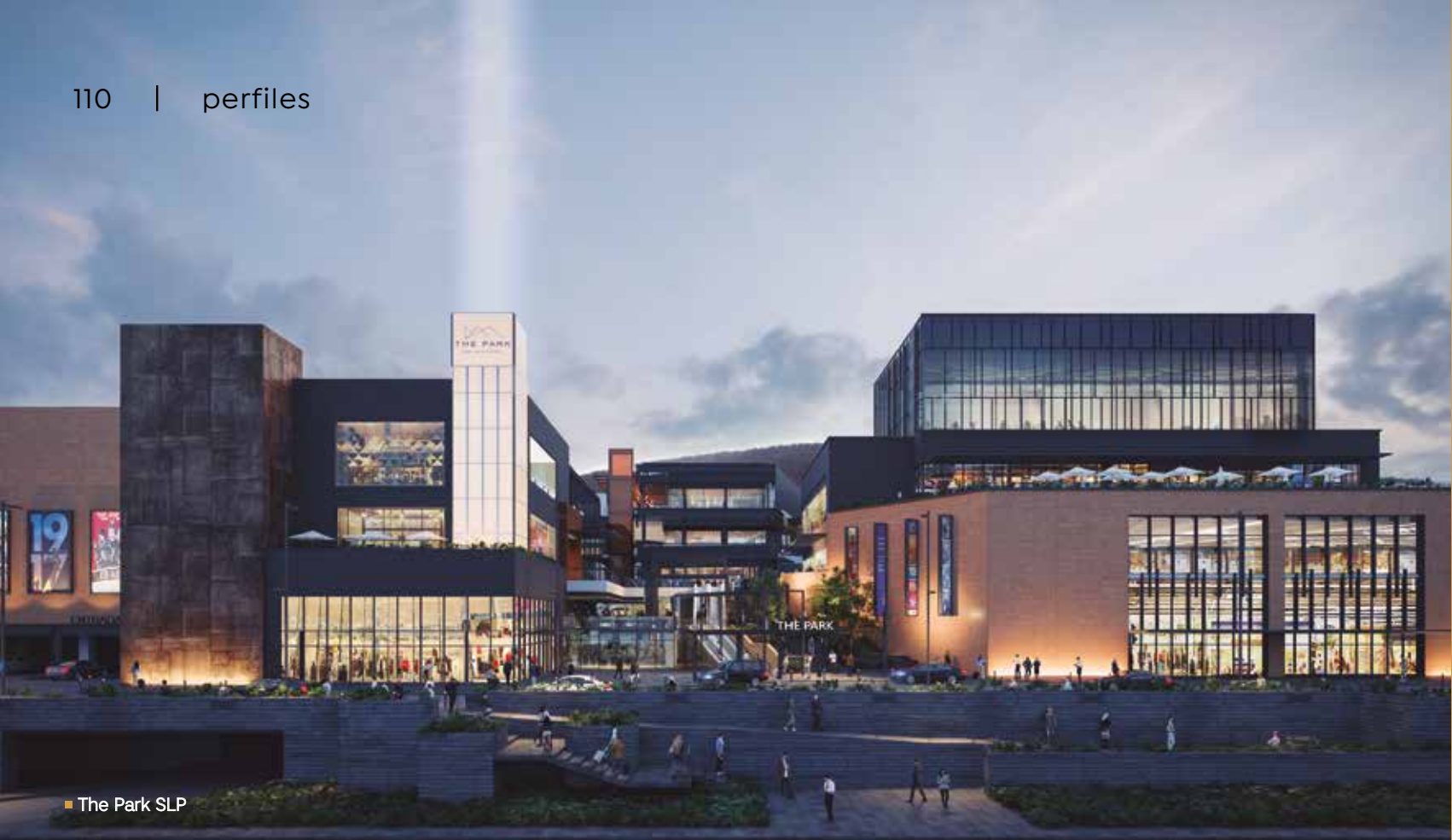
■ The Park SLP

"EN GROW NOS GUSTA LOGRAR QUE CADA PROYECTO SE INTEGRE CON SU ENTORNO" — BERNARDO CANTERO