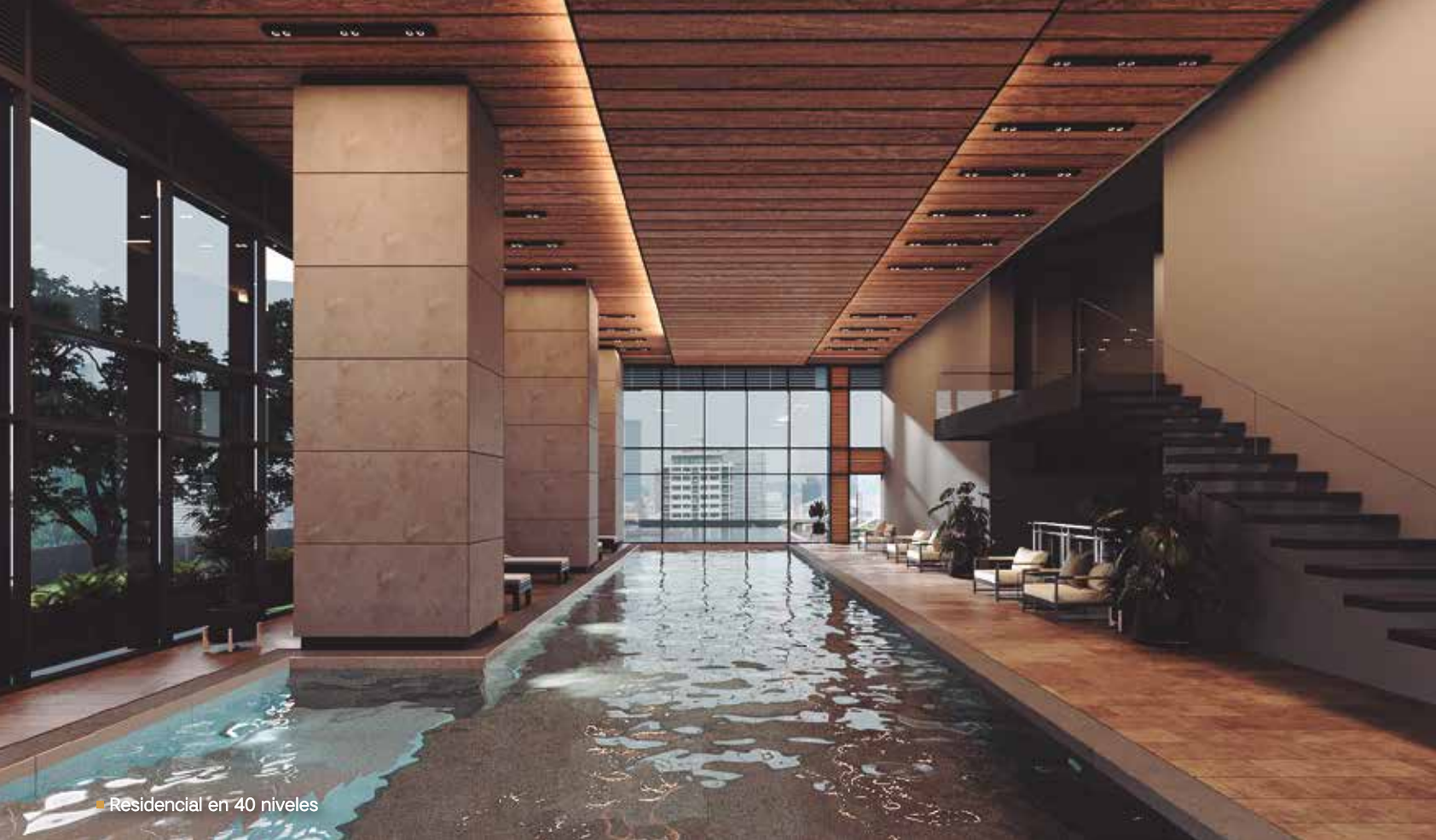
Residencial en 40 niveles

Este año Grow comienza, reactiva y continúa con proyectos arquitectónicos comerciales muy grandes, tan monumentales como edificios residenciales o centros comerciales. Ante la recesión vivida por la pandemia, ¿cree usted que estos proyectos ya nos hablan de una mejoría económica?